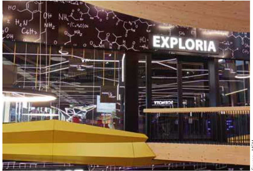
La salle Exploria où a eu lieu cette journée consacrée à la digitalisation des systèmes de production.

L'Innovation Tour sera ainsi le trait d'union entre le monde de l'entreprise et celui de l'innovation. Il est conçu à l'image des déplacements internationaux où une délégation d'industriels voyage de