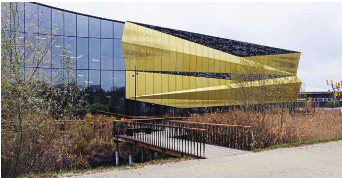
Le bâtiment EXPLORiT sur le site d'Y-Parc.

inter-entreprises et qui court jusqu'à fin 2023. Toutes les entreprises qui auraient ce type de projet peuvent nous contacter » conclut Mme Gasser.